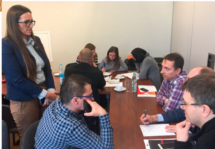
Praca w grupach podczas szkolenia w Polsce

Stworzony został program szkolenia wykorzystujący zestaw różnych, skupionych na efektywności, metod nauczania: klasyczne szkolenie, otwarta szkoła zarządzania, wirtualna mobilność i staże towarzyszące, tzw. „lab shadowing”. Podczas szkolenia wśród grupy uczestników zauważono wzrost umiejętności zarządczych i zawodowych. Ze względu na potrzebę dostarczenia wiedzy eksperckiej, zajęcia były prowadzone przy wsparciu publicznej i prywatnej kadry specjalistów, w której skład wchodziłi eksperci, instruktorzy szkoleniowi, pracodawcy z sektora. Poprzez szkolenie, włoskie organizacje ustanowiły strategiczną współpracę w obrębie sektora, w celu zidentyfikowania i opracowania odpowiednich działań, które pozwolą dostosować podaż i popyt na kompetencje zawodowe. Dzięki wyjątkowo sprawnej współpracy w obszarze sektora, uczestnicy zyskali doskonałe perspektywy na rynku pracy.