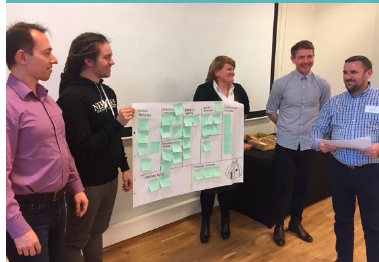
Prezentacja Kanwy Modelu Biznesowego opracowanej podczas polskiej edycji pilotażu