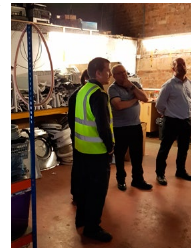
Szkolenie pilotażowe w Wielkiej Brytanii

Szkolenie świadczone przez UCLan obejmowało tradycyjne szkolenie w klasie, naukę samodzielną i zajęcia praktyczne, a także sesję on-line, która była również dostępna dla uczestników z innych krajów partnerskich. W przypadku Open Management School uczniowie przygotowali dwa kompletne modele biznesowe i podczas zajęć w klasie omówiono i opracowano przesłanki leżące u ich podstaw, w celu uwzględnienia społecznych aspektów, z którymi zmagają się organizacje tego sektora.