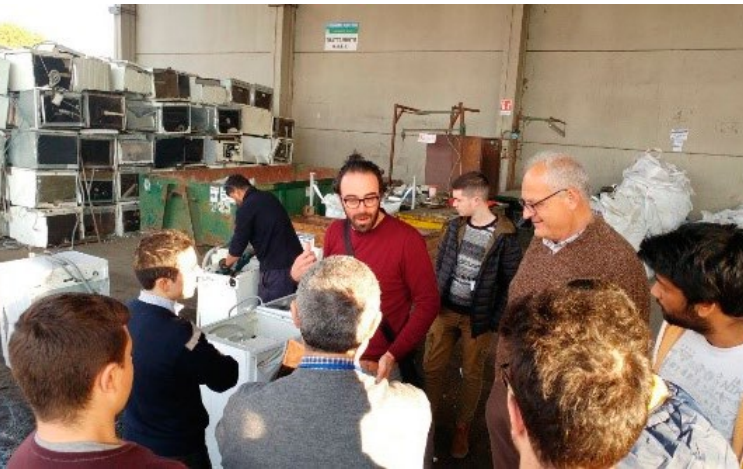
Staże towarzyszące (Włochy)

KONSORCJUM EWASTER SKŁADA SIĘ Z 13 ORGANIZACJI Z CZTERECH KRAJÓW - CYPRU, WŁOCH, POLSKI I WIELKIEJ BRYTANII. PROJEKT ZARZĄDZANY JEST PRZEZ E.RI.FO - ENTE PER LA RICERCA E FORMAZIONE (RZYM, WŁOCHY).